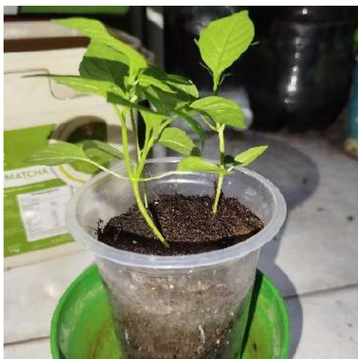
Gambar 4. Tanaman cabai pada hari ke-10 menunjukkan pertumbuhan daun dan batang yang lebih optimal

mempertimbangkan kandungan unsur hara dan efektivitas aplikasi lapangan, formulasi pupuk ini juga menawarkan solusi pengelolaan limbah yang berkelanjutan. Integrasi limbah pertanian dan sisa organik menjadi pupuk siap pakai tidak hanya meningkatkan produktivitas pertanian, tetapi juga membantu mengurangi beban pencemaran lingkungan. Ke depannya, pengembangan lebih lanjut terhadap skala produksi, stabilitas nutrisi, dan efisiensi penyerapan tanaman sangat penting dilakukan guna mendukung implementasi pupuk organik ini secara luas di kalangan petani maupun pekebun urban.