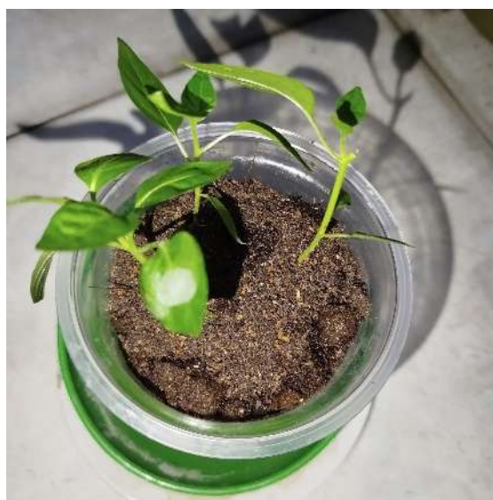
Gambar 3. Pertumbuhan awal tanaman cabai pada hari ke-1 dengan daun masih muda dan batang belum kokoh

Hasil ini menunjukkan bahwa pupuk padat hasil kombinasi bahan organik mampu memberikan kontribusi positif terhadap pertumbuhan vegetatif tanaman dalam waktu relatif singkat. Kandungan nutrisi esensial dan mikro pada pupuk ini mendukung pertumbuhan yang sehat dan kuat. Dengan